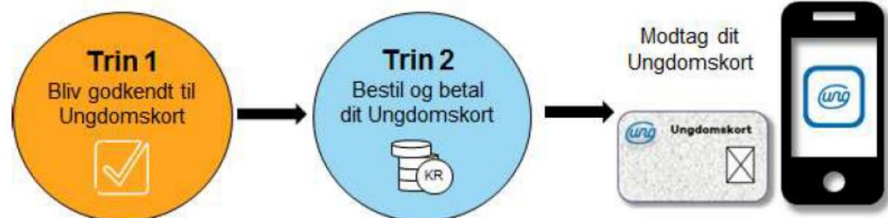
Figur 4 fra ungdomskort.dk

Først skal den unge indhente en godkendelse til at kunne købe et ungdomskort på ungdomskort.dk. Det kræver i ca. en tredjedel af tilfældene manuel sagsbehandling, hvorfor det kan tage tid.